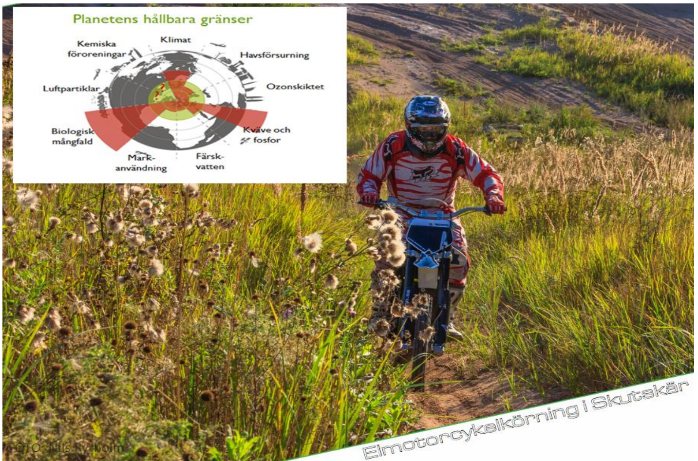
Figur 1 På bilden körning med elmotorcykel 2011 på den artrika motorbanan i Skutskär som hålls öppen tack vare klubbens motorsportaktiviteter.

"Planetens gränser" är ett välkänt begrepp/koncept globalt. 1