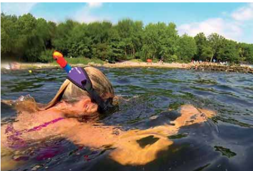
Svärjarehålan nära Tylösand i Halmstad är en omtyckt och välbesökt badplats som är tillgänglig även för funktionsnedsatta.

Sedan 2016 har Halmstad kommun tagit över skötseln av snorkelleden. Undervattensskyltar nöts fort och det händer att vinterstormarna sliter sönder dem.