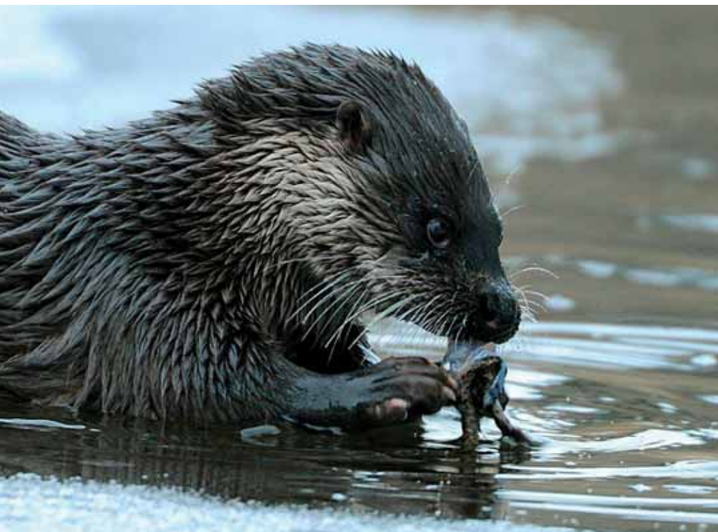
Jönköping är sedan länge en uttervänlig kommun där man kan få se spår av uttrar som har kanat på magen mitt inne i stan.

– Men plötsligt dök det ändå upp ett mörkt huvud i en kanal! Det tror jag fick alla att vakna till och känna lite extra för uttrarna och deras infrastruktur.