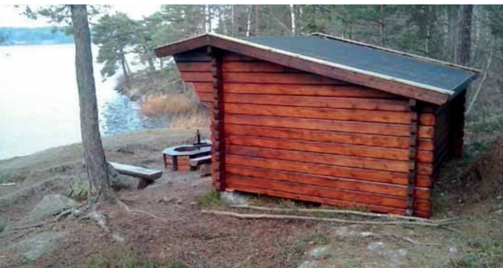
Slätterfibblans och gröngölingens landskap har blivit mer välkommande i Lejondals naturreservat.