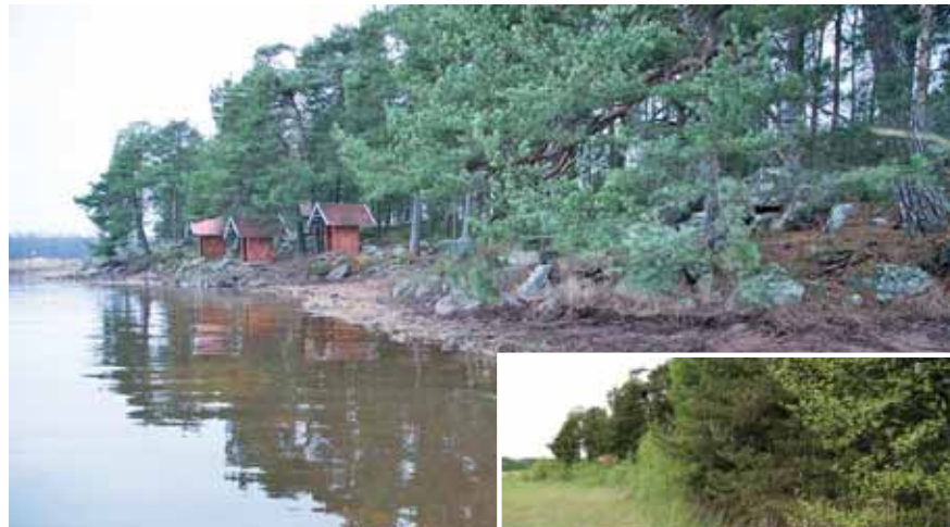
Med hjälp av grävskopor kan en igenvuxen strand få nytt liv.