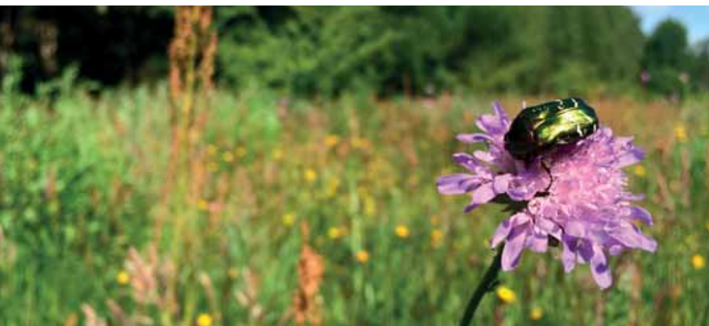
En grönare skolmiljö gynnar både lek, hälsa och ekosystemtjänster som pollinering.