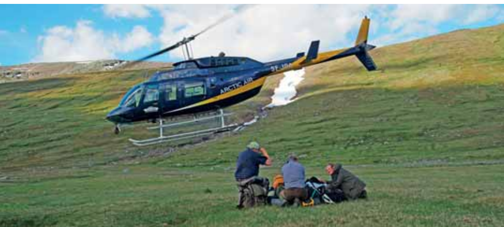
Till de mest otillgängliga delarna av Pite lappmark är det helikoptertransport som gäller. Här är inventerarna avsläppta efter transport till Vourdnatsdalen.

Genom föreningens inventeringsprogram har några av Sveriges främsta botaniker upptäckt Pite lappmark och tycker att det är väl så intressant som, och helt klart kan jämföras med, berömda botaniska områden som både Padjelanta och Abisko.