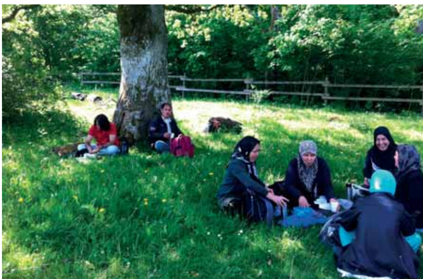
Projektet Natur för nysvenskar är avslutat men naturum Skrylle fortsätter att jobba med målgruppen, bland annat i ett nytt Lona-projekt med namnet Ut i spenaten – allemansrätt för alla.

– När vi hade ordnat bussar dök det ofta upp fler klasser som ville hänga med, så det var ju jättekul!