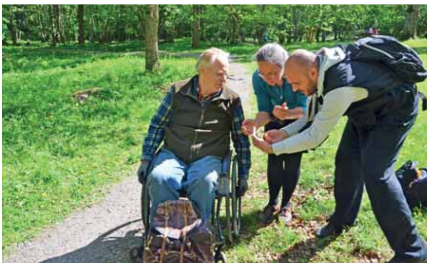
Hopajola bildades 1994 som en reaktion på att Örebro län hade rankats som sämst i Sverige när det gällde skyddad natur. Numera är länet istället känt för att ligga långt fram när det gäller naturvård.

Hennes bästa tips är att sätta sig själv i en rullstol och testa. Hopajola har också ordnat guidningar för seende där man får prova att vara synskadad för att förstå hur det är att ta sig runt i naturen med dålig syn.