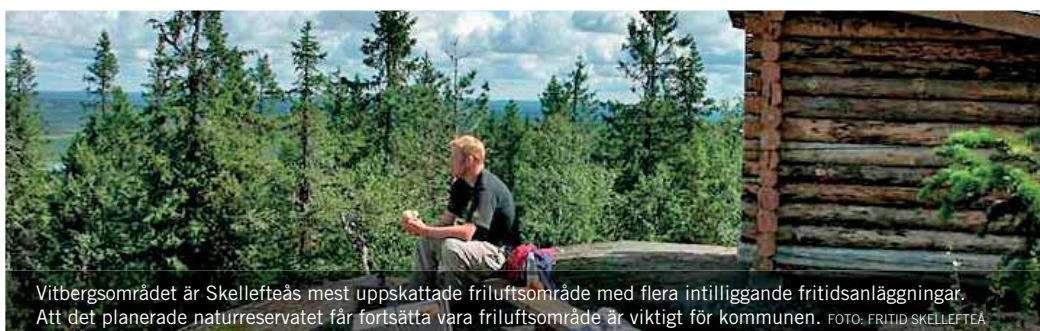
Vitbergsområdet är Skellefteås mest uppskattade friluftsområde med flera intilliggande fritidsanläggningar. Att det planerade naturreservatet får fortsätta vara friluftsområde är viktigt för kommunen.

– Vi har tagit höjd för detta i föreskrifterna som anger att skogen i området inte får brukas i ekonomiskt syfte men däremot att fritidsvärdena ska kunna utvecklas. Mountainbike är definitivt ett sådant. Intresset går spikrakt uppåt och även antalet utövare. Krocken mellan fotgängare och cyklister är det största hindret men med fortsatt dialog och bra planering går det att