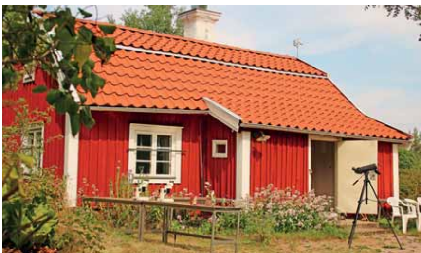
I Kvarnhagstorp i Strömsholms naturreservat bedrivs nu naturskola för skolelever från förskoleklass upp till nian. Här får barnen möjlighet att uppleva naturen på riktigt, något som inte är en självklarhet för alla idag.

Naturskolan i Kvarnhagstorp är tänkt att användas för barn från förskolan upp till årskurs nio.