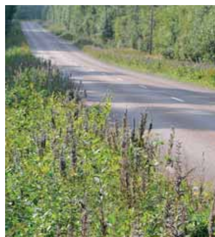
Vägkanter kan sägas vara vår tids nya ängsmark. Problemet med lupiner är att de gödslar upp marken eftersom de är kvävefixerare och tränger ut växter som klarar magrare förhållanden.

Ett påtagligt resultat av projektet är att Trafikverket nu har valt ut en av områdets vägsträckor som identifierats som särskilt viktig att varna och där ska man nu sätta in åtgärder mot lupiner.