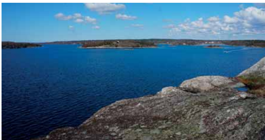
Hittaut.nu-hemsidan är levande och byggs hela tiden på med information. Det kan till exempel handla om var det finns intressanta växter och djur att upptäcka just nu.

– Vi har valt öar dit det inte brukar komma så mycket folk men där det