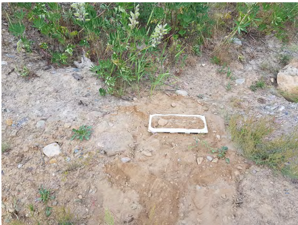
Bild 4. Fallfälla för marklevande insekter.

De två fallfällorna sattes ut vid det första besöket den 12/6 och tömdes två gånger under sommaren (19/8 och 15/9). Vid det sista besöket togs fällorna också bort. Fällor av olika slag är ofta ett bra komplement till fältbesök. De är igång dygnet runt och fångar ofta djur som är svåra att finna vid dagsök. Anledningen till att de är svåra att finna beror på att de är nattaktiva och/eller lever en stor del av sina liv i markförnan, underjordiskt eller vid basen av växter. Fallfällorna på Eliantorps motorbana ökade antalet funna arter avsevärt och gav en bra bild av den marklevande skalbaggsfaunan.