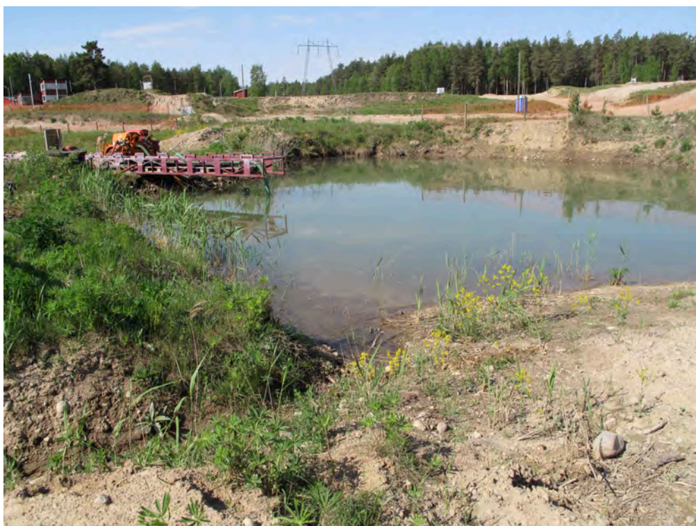
Bild 3. En damm ökar mångfalden och bidrar till områdets artrikedom. Trots att året var en av de varmaste på länge, så höll dammen vatten under hela sommaren. Här noterades också en obestämd vattensalamander.

Sommaren 2018 präglades av låg nederbörd och höga temperaturer, vilket medförde snabbt övergående blomning av områdets blomresurser, vilket i sin tur kan ha påverkat hög- och sensommarens besök negativt.