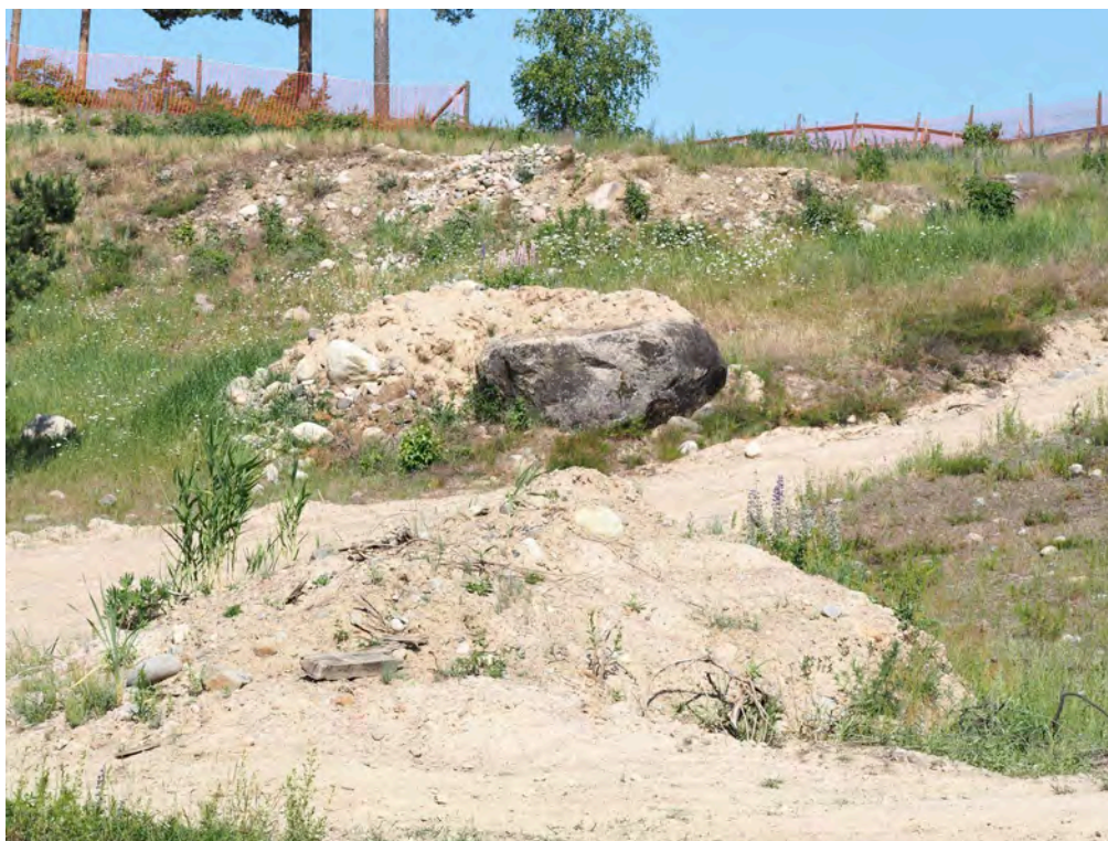
Bild 2. En bra mosaik med öppen sand och växtlighet.

Gaddsteklar och skalbaggar var i fokus för denna inventering, medans naturvårdsarter prioriterades för andra insektsgrupper. I uppdraget ingick också att sammanställa resultaten av inventeringen i en rapport, som härmed presenteras.