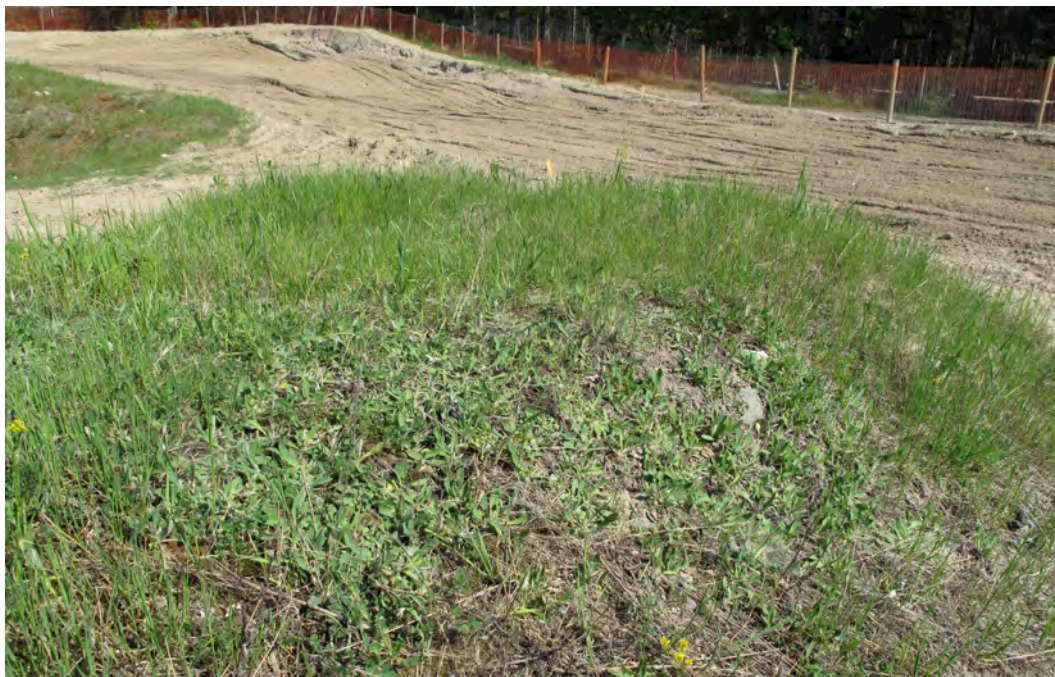
Bild 13. Det ljusgrågröna i mitten är gråfibblor i en så kallad fibblematta och är en viktig resurs för insekter när den blommar. Denna miljö är viktig att ta hänsyn till, och om möjligt spara eller flytta, vid tillfällen när banan läggs om.