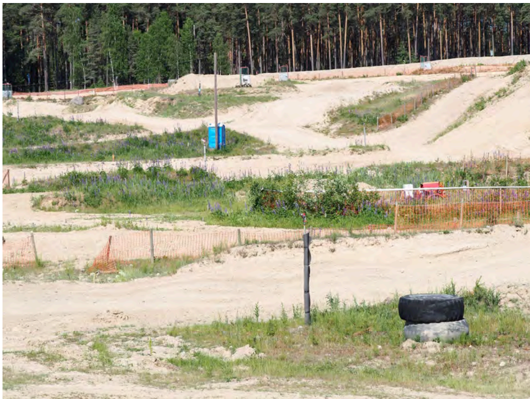
Bild 14. Mellan banorna i bildens vänstra del dominerar blomsterlupinen som konkurrerar ut andra viktiga blommande växter i området.