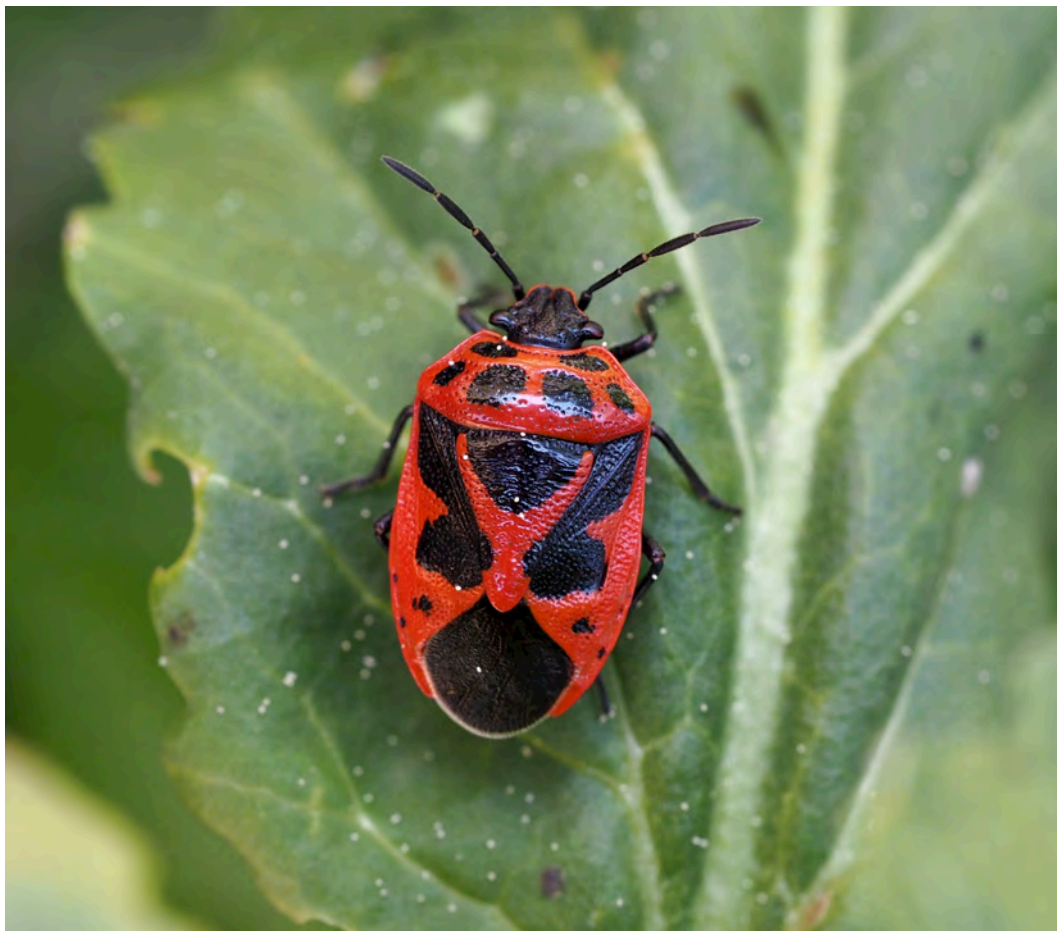
Bild 10. Bräsmabärfis Eurydema dominulus .