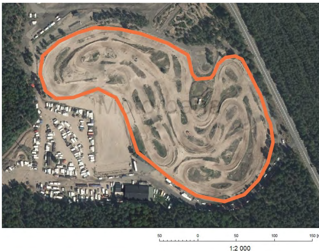
Bild 1. Eliantorps motorbana. Inventeringsområdet markerat med orange linje.

Sammanfattningsvis kan man konstatera att Eliantorps motorbana är ett mycket viktigt område för ett flertal av de förekommande arterna. Det är också ett av Östergötlands värdefullaste, om inte det mest värdefulla, områden för dessa sandmarksinsekter och även ett viktigt område ur nationell synpunkt för hotade vildbin och andra sällsynta sandmarksinsekter.