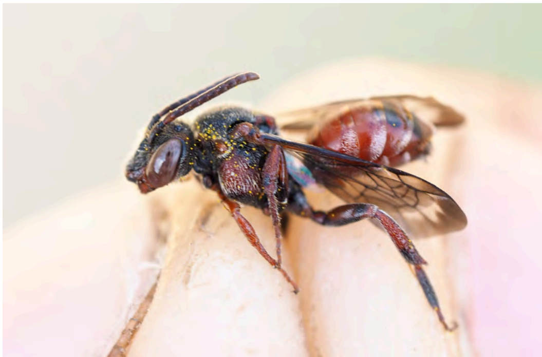
Bild 6. Det mycket sällsynta silvergökbiet Nomada argentata EN.