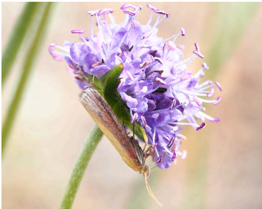
Bild 12. Käringtandmott Oncocera semirubella .

Ett stort och färggrant mott med rosa och gula fält på framvingarna. Käringtandmottet lever av käringtand och andra ärtväxter, och uppträder lokalt i delar av Svealand och Götaland. Arten uppträder bara i solvarma och torra miljöer och ansågs tidigare vara en stor raritet. Under de senare decennierna har den dock spridit sig i framför allt Svealand. En individ noterades på blommande ängsvädd i den södra delen av motorbanan.