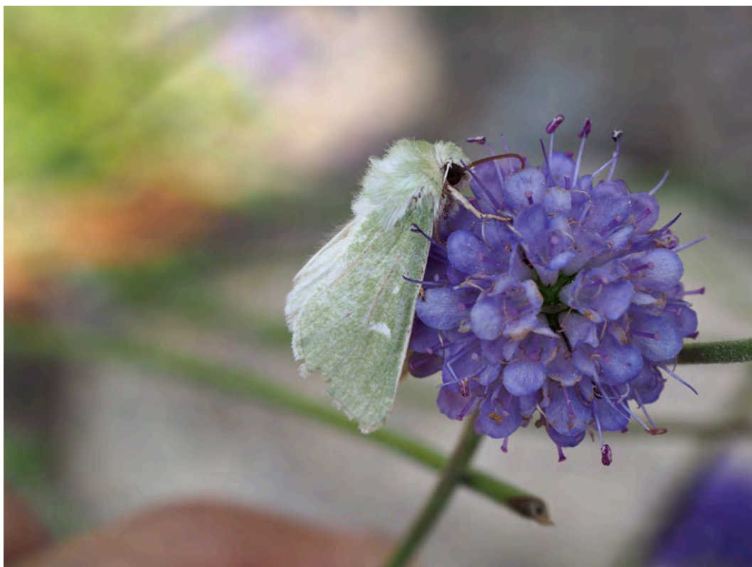
Bild 9. Grönt hedmarksfly Calamia tridens .

En individ noterades då den födosökte på blommande ängsvädd i den södra delen av området och två individer sågs uppe vid parkeringen norr om själva banområdet. Även dessa två födosökte på ängsvädd.