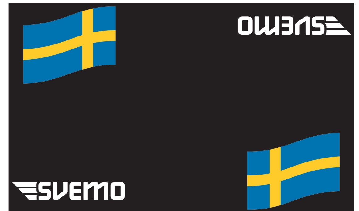
Svemos officiella miljömatta. Finns att beställa på svemo.se